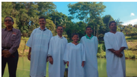
Batismo ICE Residencial América