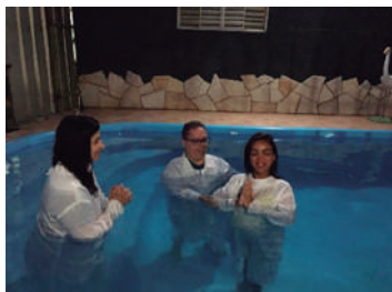
Batismo ICE Paraíso

Batismo nas ICE Residencial América e ICE Paraíso – Foi dia 12 de dezembro. Que Deus continue frutificando os ministérios de nossa região!