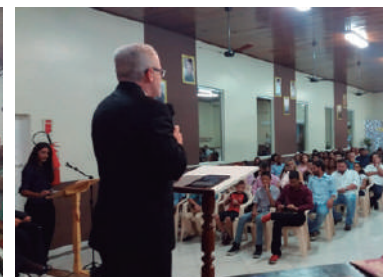
ICE em Barra dos Garças

Formatura da 1ª Turma do CTM - No dia 09/02 houve o Culto de Formatura da primeira turma do Curso Teológico por Módulos (SETECEB) em Cuiabá.