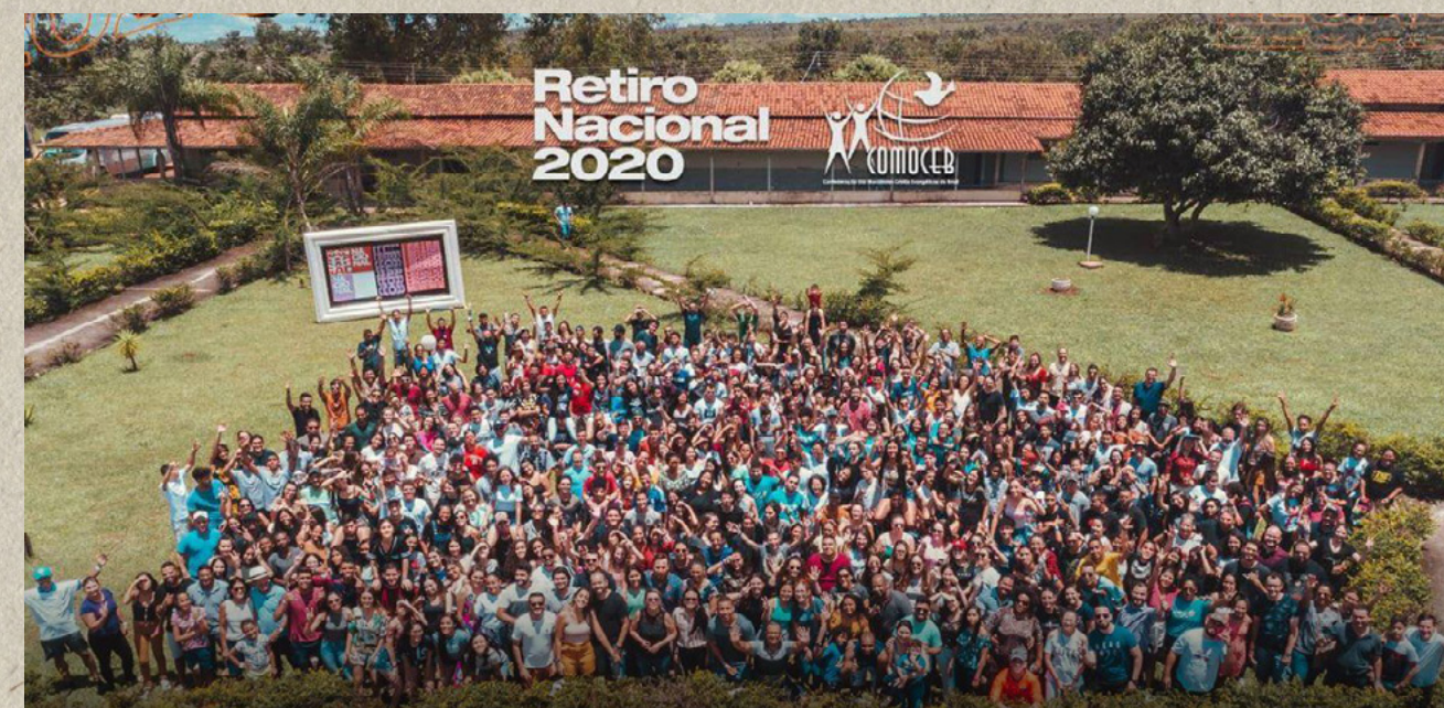
Retiro Nacional da COMOCEB 2020 – Cocalzinho/GO