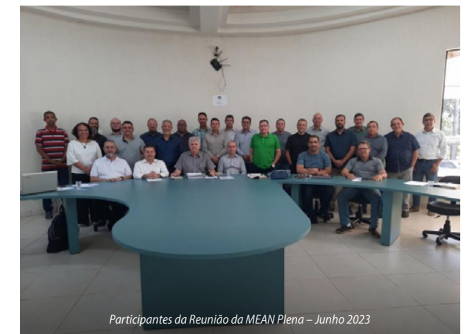
Participantes da Reunião da MEAN Plena - Junho 2023