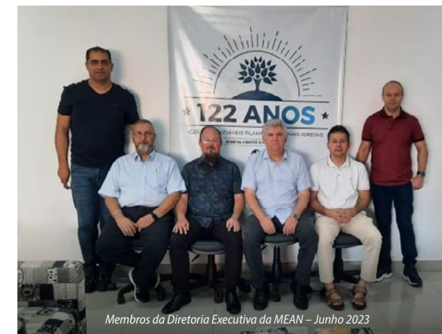
Membros da Diretoria Executiva da MEAN - Junho 2023

minação, inclusive avaliando as atividades denominacionais já executadas e tomando novas decisões necessárias. Essa é uma grande responsabilidade. Louvamos a Deus por suas vidas, e somos gratos pela disposição de todos eles em deixar por um tempo suas famílias, Igrejas e demais afazeres cotidianos para se dedicarem a este importante trabalho. Oremos para que Deus continue a abençoá-los em todas as decisões, e por nossas Igrejas e pelos nossos pastores e suas famílias!