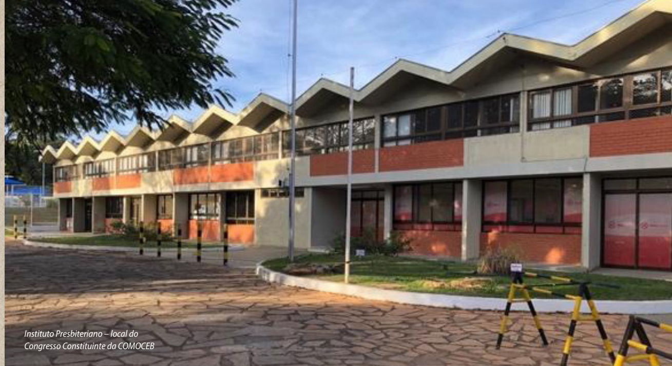
Instituto Presbiteriano – local do Congresso Constituinte da COMOCEB